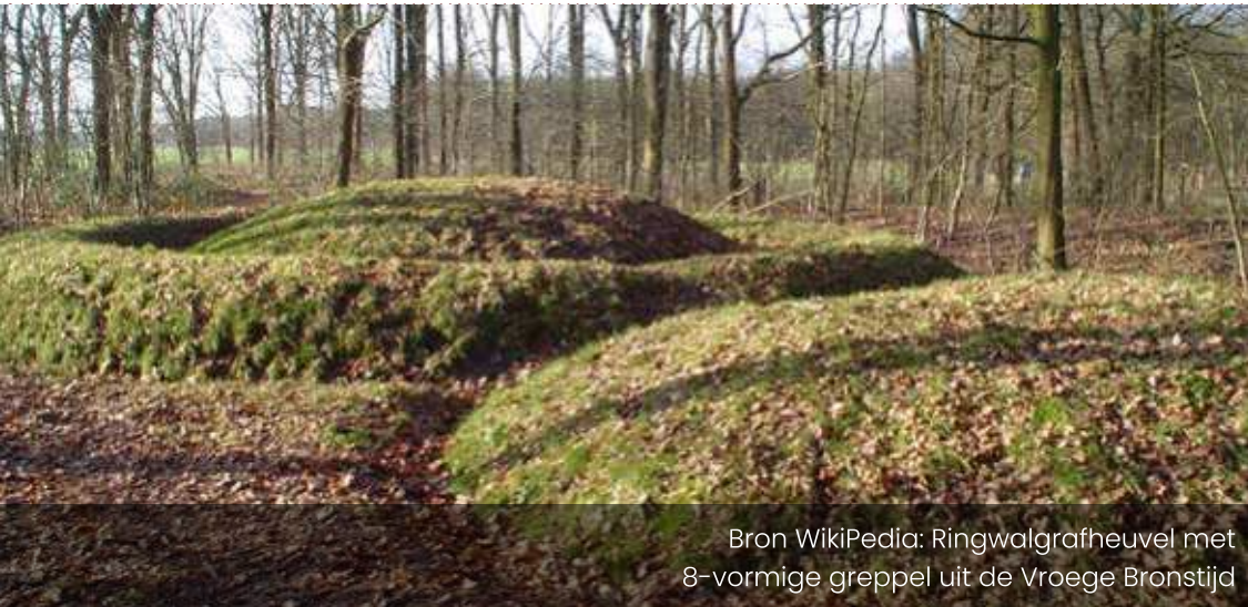
Ringwalgrafheuvel met 8-vormige greppel uit de Vroege Bronstijd

Door deze strategieën toe te passen, kunt u uw woonruimte transformeren tot een plek die niet alleen functioneel is, maar ook esthetisch aangenaam en comfortabel om in te leven.